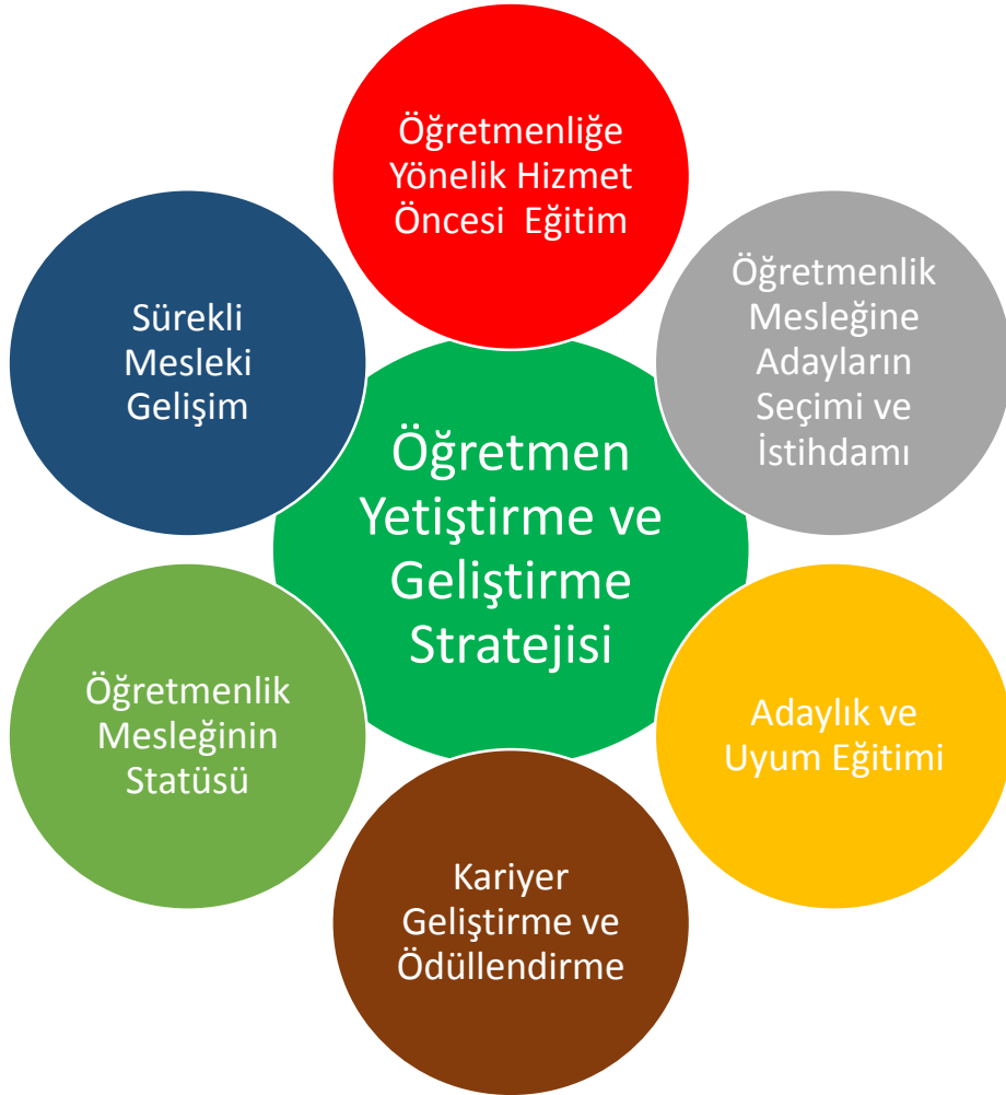
Şekil 1. Öğretmen Strateji Belgesi Ana Temalar

Öğretmen strateji belgesinde öğretmenlik mesleğine yönelik politikaların geliştirilmesi için, gerek öğretmenlik mesleğine ilişkin süreçler gerekse temel sorun alanları göz önünde bulundurularak 6 ana tema belirlenmiştir. Belgede yer alan amaç, hedef ve eylemler Şekil 1’de yer alan ana temalar dikkate alınarak oluşturulmuştur.